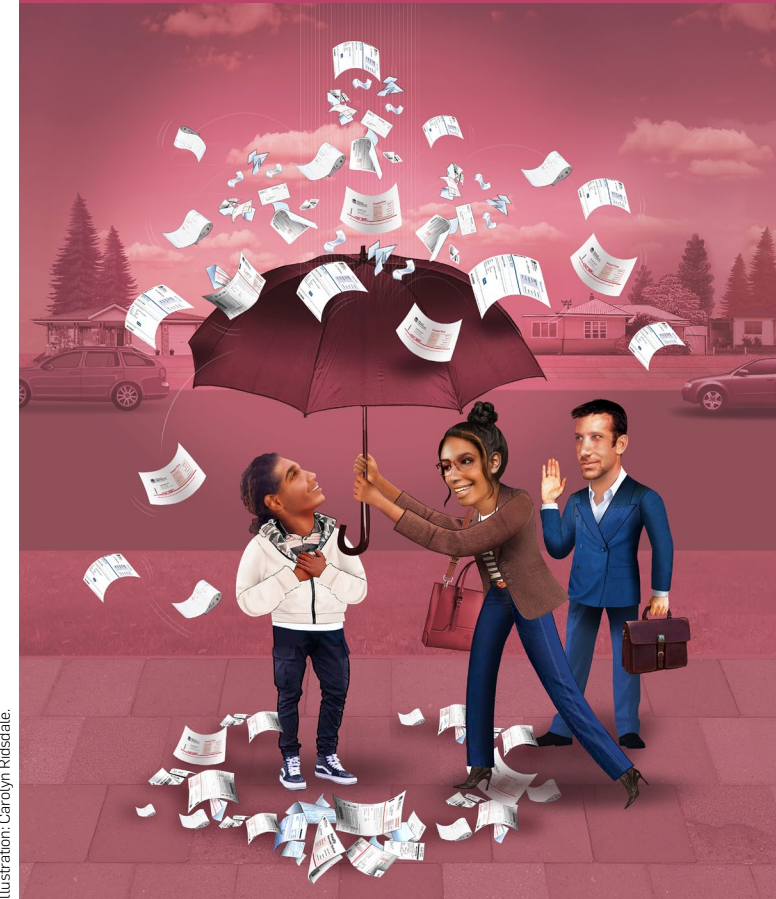
Illustration: Carolyn Ridsdale.